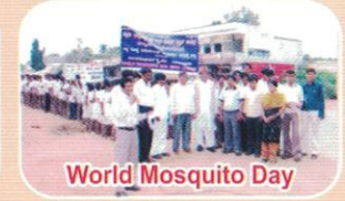
World Mosquito Day