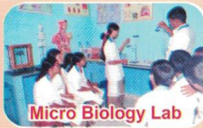
Micro Biology Lab