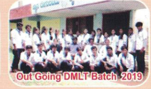
Out Going DMLT Batch 2019

ವಿಶೇಷತೆಗಳು: ನುರಿತ ಉಪನ್ಯಾಸಕರಿಂದ ಬೋಧನೆ, ಉತ್ತಮ ಗ್ರಂಥಾಲಯ, ಪ್ರಯೋಗಾಲಯ, ಸುಸಜ್ಜಿತ ತರಗತಿಗಳ ಕೊಠಡಿ, ಕ್ಲಿನಿಕಲ್ ತರಬೇತಿಗೆ ತಾಲೂಕ್ ಸರ್ಕಾರಿ ಆಸ್ಪತ್ರೆ ಆರೋಗ್ಯ ಸಮದಾಯ ಕೇಂದ್ರ, ಸರ್ಕಾರಿ ಹೆರಿಗೆ ಆಸ್ಪತ್ರೆ, ಖಾಸಗಿ ಲ್ಯಾಬ್‌ಗಳಲ್ಲಿ ವಿದ್ಯಾರ್ಥಿಗಳಿಗೆ ತರಬೇತಿ ನೀಡಲಾಗುವುದು. ಗ್ರಾಮೀಣ ಹಾಗೂ ಅನ್ಯ ನಗರದ ವಿದ್ಯಾರ್ಥಿಗಳಿಗೆ ರಾಜ್ಯ ಸಾರಿಗೆ ಸಂಸ್ಥೆಯಿಂದ ರಿಯಾಯಿತಿ ದರದಲ್ಲಿ ಬಸ್‌ಪಾಸ್ ಸೌಲಭ್ಯ, ವಿದ್ಯಾರ್ಥಿಗಳಿಗೆ ಸರ್ಕಾರಿ ವಸತಿ ನಿಲಯ ವ್ಯವಸ್ಥೆ, ಎಸ್.ಸಿ/ಎಸ್.ಟಿ, ಅಲ್ಪಸಂಖ್ಯಾತ, ಓ.ಬಿ.ಸಿ ವಿದ್ಯಾರ್ಥಿಗಳಿಗೆ ಸರ್ಕಾರದ ಹಾಗೂ ಖಾಸಗಿ ಸಂಸ್ಥೆಗಳಿಂದ ಸ್ಕಾಲರ್‌ಶಿಪ್ ಸೌಲಭ್ಯ ಉತ್ತಮ ಫಲಿತಾಂಶ.