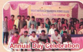
Annual Day Celebration