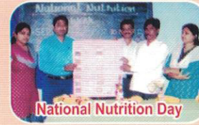
National Nutrition Day