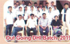
Out Going DHI Batch 2019